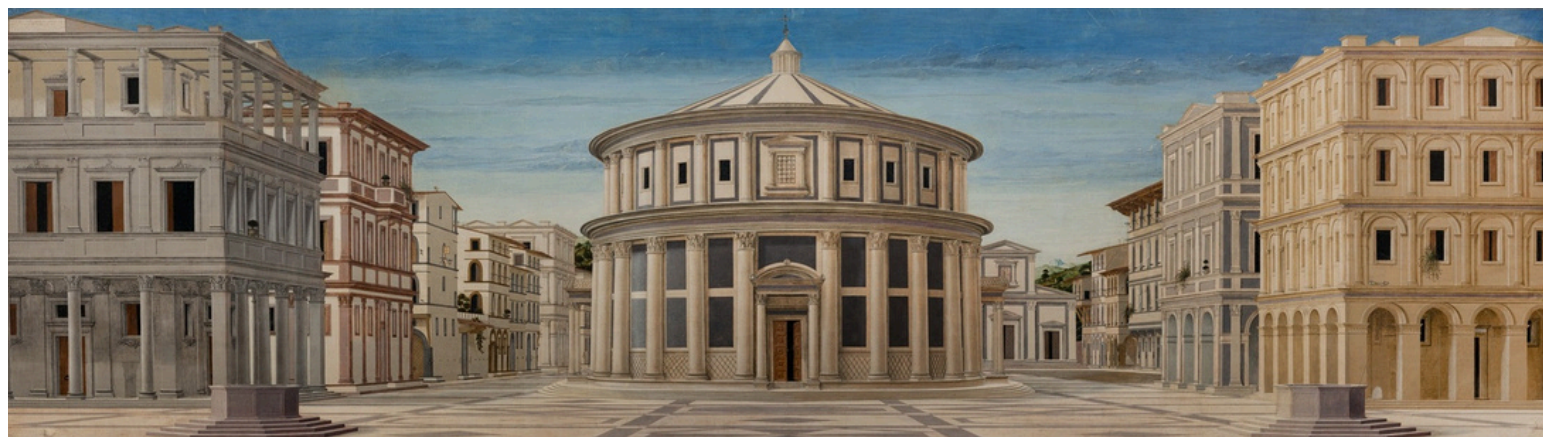
"Città Ideale" Olio su tela - Artista Anonimo 1480/1490

Newsletter dell'Ufficio di Segreteria della Conferenza Stato-città ed autonomie locali